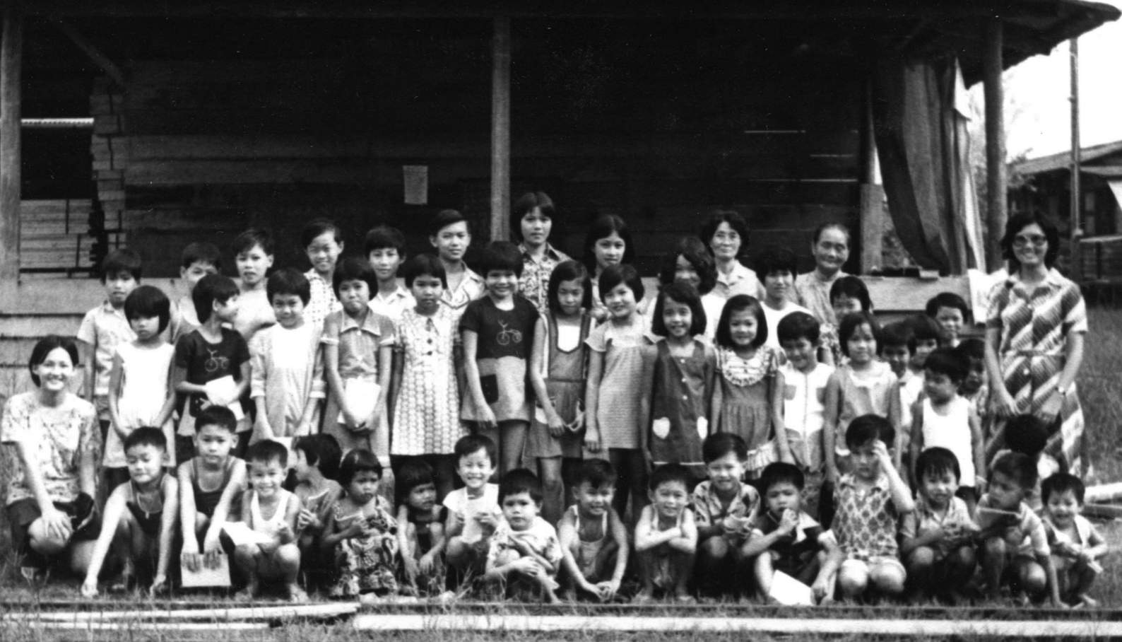
一九七六年 建森板厂 儿童主日学