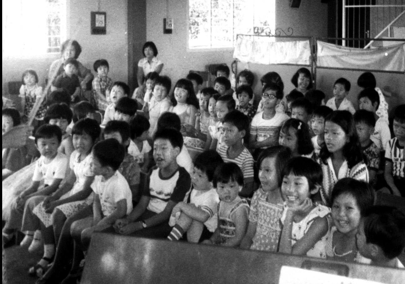
一九七七年 晋光堂儿童主日学