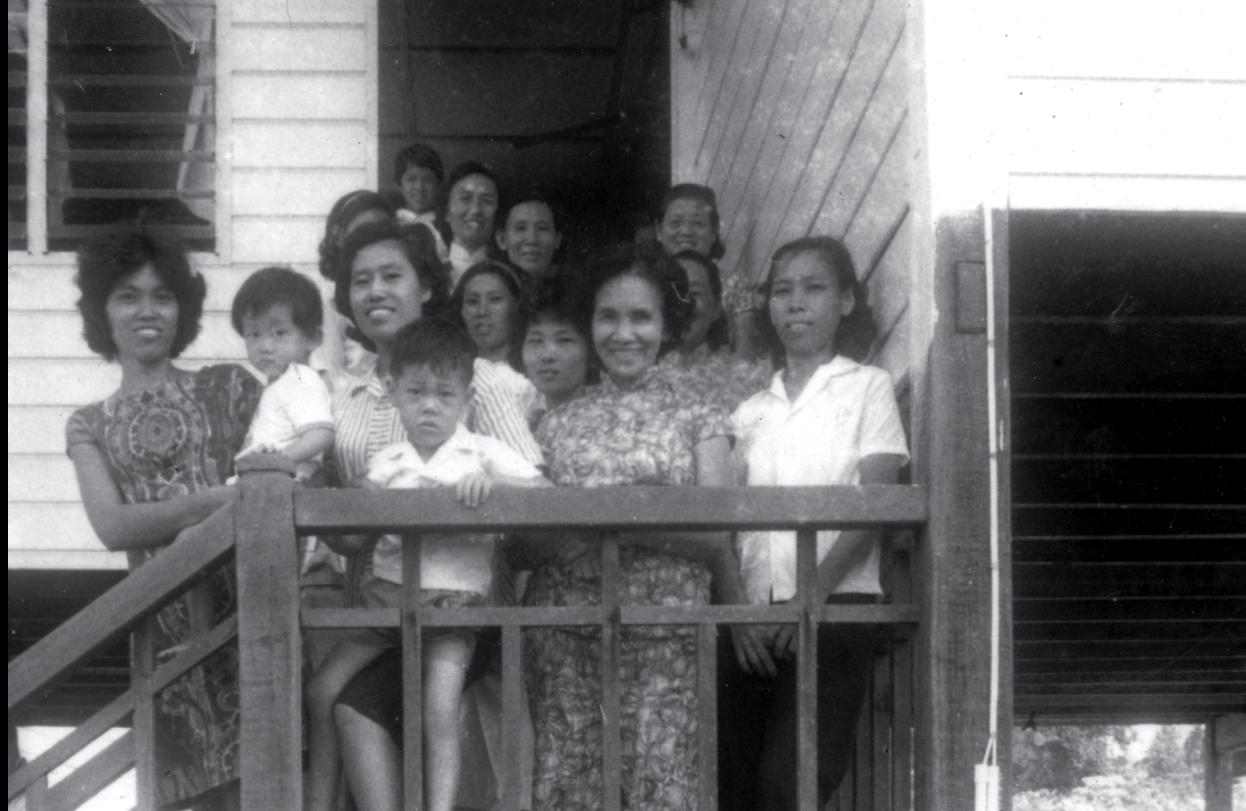
一九六〇年代 砂拉越民都鲁 民恩堂妇女会