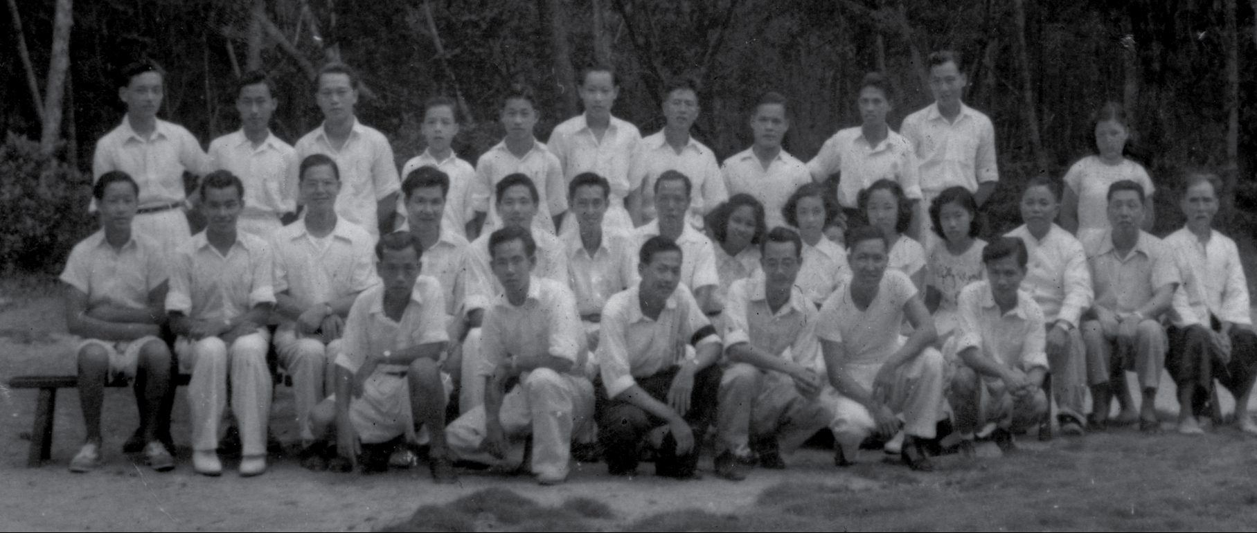
一九五〇年代 卫理青年团契