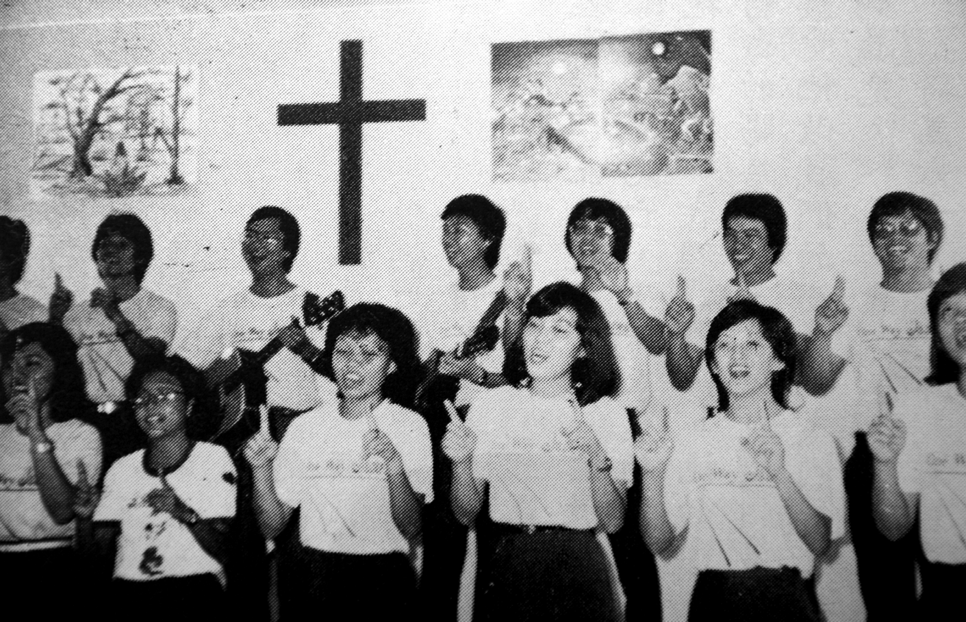
一九八三年 以勒歌唱团 在民达华儿童 布道会献唱