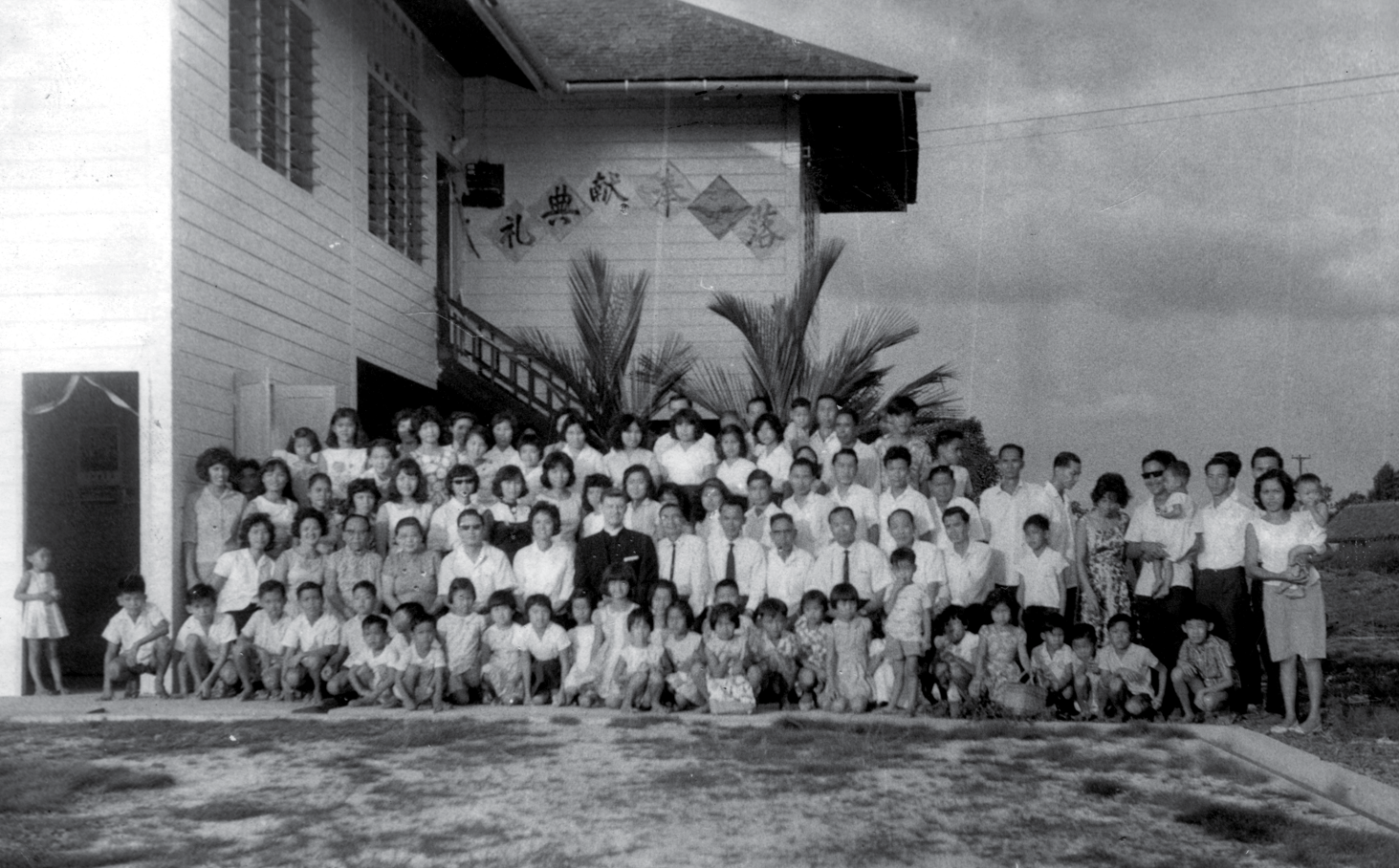
一九六〇年代 砂拉越民都魯 民恩堂新堂落成